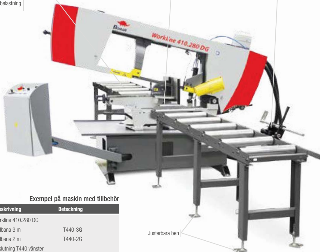
Exempel på maskin med tillbehör