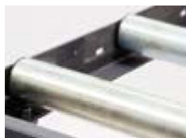
System T är försedd med rullar med en diameter av 70 mm och klarar av hög belastning

Med en lastkapacitet på 600 kg/m, ett omfattande tillbehörsprogram och anslutningsdetaljer till bandsågar av typen Bomar är system T en idealisk utrustning för hantering av material i er verkstad. Med modulängder på 2 och 3 meter kan rullbanorna enkelt anpassas för alla arbetsuppgifter.