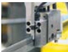
Micronizer dimsmörjning Idealiskt tillbehör som säkerställer kylning och smörjning genom dimsmörjning då rör och profiler kapas.