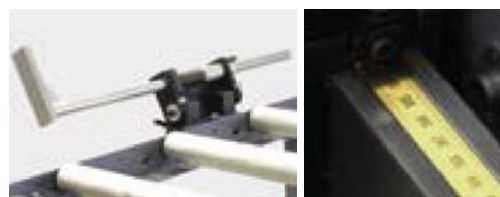
TA - Manuellt anslag med måttband