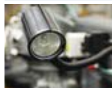
Arbetslampa - halogen Den kraftiga halogenlampan belyser hela arbetsområdet