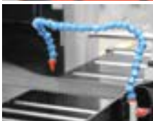
Extra skärvätskemunstycke För breda material kan ett extra skärvätskemunstycke monteras. Det extra skärvätskemunstycket är flexibelt och kan enkelt anpassas efter materialets form.