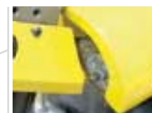
Spånborste för rengöring av sågblad