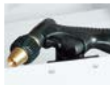
Spolpistol Spolpistolen används för snabb och enkel renspolning av maskinen