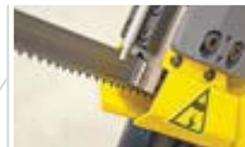
Bladstyrningar av hårdmetall