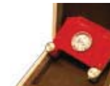
Tenzomat Manuell bladspänningsmätare som genom mekanisk töjningsmätning med hög precision används för att kontrollera bladspänning vid byte av bandsågblad.