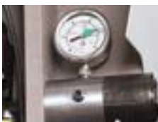
Mätare för bladspänning Denna hydrauliska enhet gör det enkelt att hela tiden ha full kontroll över att bladspänningen är korrekt inställd