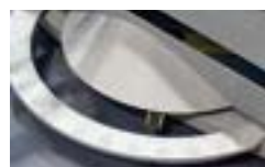
En tydlig vinkelskala för kapvinkeln är placerad på maskinens framsida