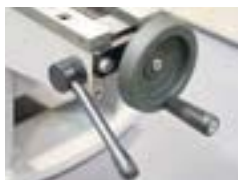
Manuellt skruvstycke med Quickmove snabbspänningsanordning