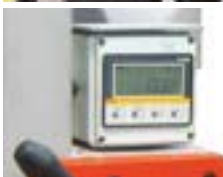
Digital visning av kapvinkel Digital visning av kapvinkel med upplösningen 0,1°